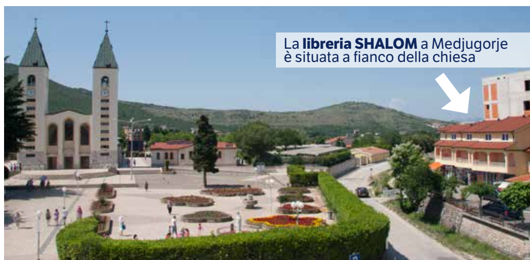
La libreria SHALOM a Medjugorje è situata a fianco della chiesa