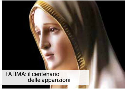
FATIMA: il centenario delle apparizioni