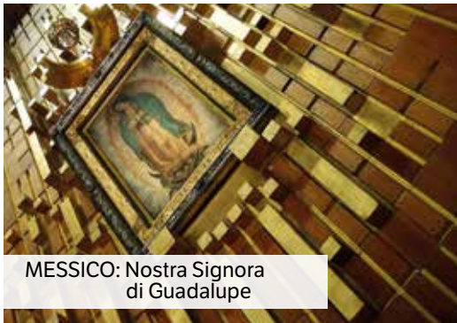
MESSICO: Nostra Signora di Guadalupe